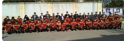
مراسم آغاز نیکارویهای جدید استفاده سازمان آتش نشانی و خدمات ایمنی شهرداری بجنورد با حضور اعضای شورای اسلامی شهر و شهردار بجنورد