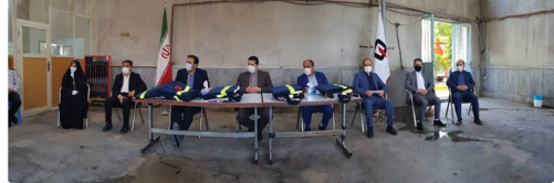
روشنایی از لباس و تجهیزات آتش نشانی سازمان آتش نشانی و خدمات ایمنی شهرداری بجنورد با حضور اعضای شورای اسلامی شهر و شهردار بجنورد