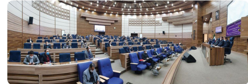
حضور ریاست و اعضای شورای اسلامی شهر بجهت بازدید از نمایشگاه شورای اسلامی شهر و شهرداران استان خراسان شمالی