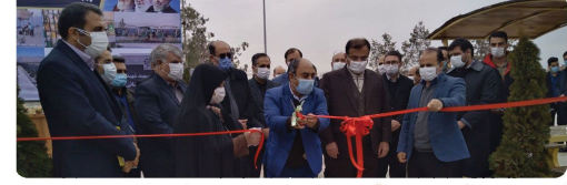
انتخاب پارک سردار نجید حاج قاسم سلیمانی در محله ناقر آباد با حضور اعضای شورای اسلامی شهر، دکتر عباسی معاون دفتر امور هماهنگی عمرانی استانداری، شهردار بجنورد