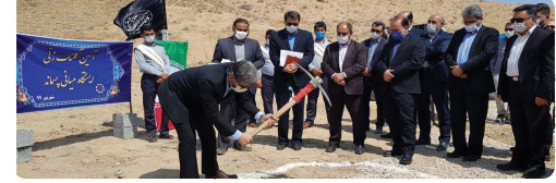
آیین گشایش احداث استگانه یبانی زلاله شهر بجنورد با حضور ریاست و اعضای شورای اسلامی شهر، شهردار بجنورد و جمعی از مدیران، مسئولین استان و شهرستان