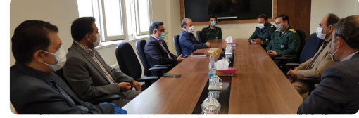
دیدار ریاست و اعضای شورای اسلامی شهر همراه شهردار بجنورد با سرهنگ الهی فر فرمانده ناحیه مقاومت بسیج شهرستان بجنورد