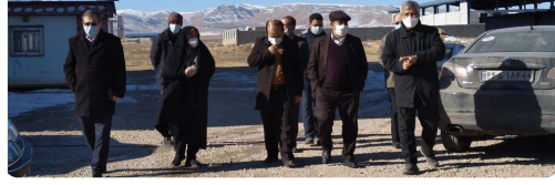
بازدید اعضای شورای اسلامی شهر بجنورد همراه شهردار بجنورد از پروژه ساختمان نگهداری سالمندان و معلولین شهر بجنورد