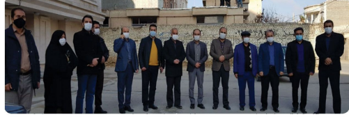
حضور اعضای شورای اسلامی شهر بجنورد همراه شهردار بجنورد در مراسم بازگشایی خیابان جمهوری