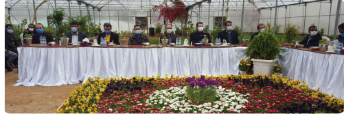
حضور اعضای شورای اسلامی شهر همراه شهردار بجنورد و جمعی از مدیران و مسئولین شهرداری بجنورد در مراسم روز درختکاری