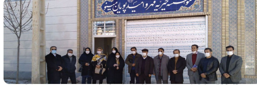
بازدید اعضای شورای اسلامی شهر بجنورد همراه شهردار بجنورد از پروژه توسعه خیریه مهر و امید یونان مینو شهر بجنورد