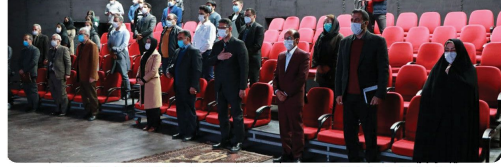
حضور اعضای شورای اسلامی شهر همراه شهردار بجنورد در مراسم اختتامیه جشنواره خانه زیبا