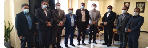
دیدار ریاست و اعضای شورای اسلامی شهر بجهت بازدید از نمایشگاه شورای اسلامی شهر و شهرداران استان خراسان شمالی