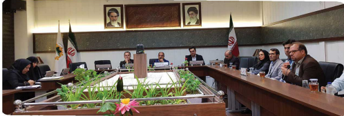
کمیسیون خدمات و زیست شهری با حضور اعضا و مدیران و معاونین شهرداری