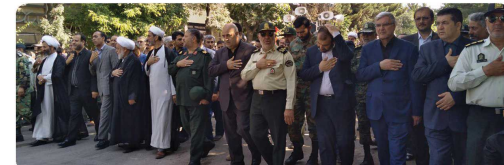
حضور ریاست و اعضای شورای اسلامی شهر بجنورد در مراسم تشیع پیکر شهید گمنام