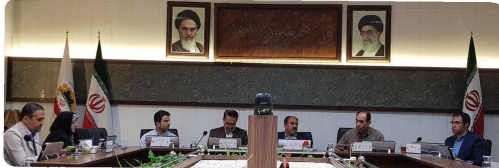
حضور روح ا... برائیان شهردار بجنورد در نود و شصتمین جلسه رسمی شورا