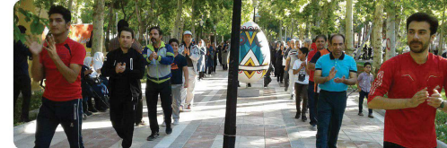
حضور اعضای شورای اسلامی شهر بجنورد در مراسم ورزش صبحگاهی سالمندان در پارک شهر