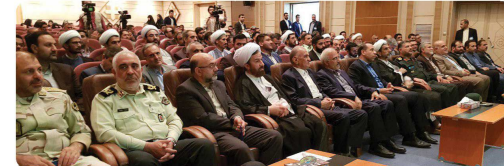
حضور اعضای شورای اسلامی شهر بجنورد در مراسم گزینان و کمک مالی به زندانیان جرایم غیر عمد