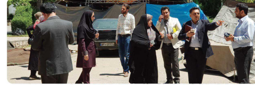
بازدید اعضای شورای اسلامی شهر بجنورد از روند برگزاری نمایشگاه و جشن فرهنگی بجنورد