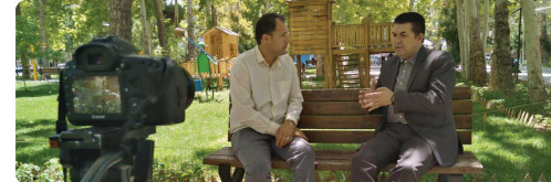
مناجبه عوامل سازنده برآه همساز شبکه مستند با ریاست شورای اسلامی شهر بجنورد جهت تهیه بسته فیلم از جنبه های گردشگری و صنعتی نواحی شهر بجنورد