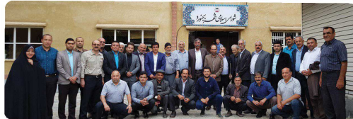
حضور پیشگويان کشتی با جوخه استان در جلسه کمیسیون ورزش و جوانان با حضور اعضای شورای اسلامی شهر