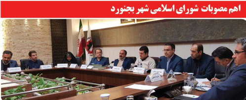
اهم مصوبات شورای اسلامی شهر بجنورد

تصویب برگزاری نمایشگاه و جشن هفته فرهنگی بجنورد ۲۴ خرداد ماه به مدت یک هفته در محل پش قارداش - تصویب تفریح بودجه سال ۹۷ شورای اسلامی شهر - تصویب تمدید قرارداد تابلوی پل تبلیغاتی حکمت در بلوار ولایت در سال ۱۳۹۸ به مدت یکسال برای تأمین داروهای بیماران خاص استان - تصویب واگذاری قرارداد زباله برداری به سازمان پسماند استان از ابتدای اردیبهشت ماه سال ۱۳۹۸ - تصویب ارائه گزارش جامع درآمد و هزینه ۶ ماهه دوم سال ۹۷ شهرداری و سازمانهای تابعه و شورای اسلامی شهر - تصویب تمدید قرارداد وصول عوارض خودرو با انجمن صنفی دقارت پیشخوان - تصویب انعقاد قرارداد راهبری کتابخانه های دانشوران و غدیر شهرداری به اداره کل کتابخانه های عمومی استان - تصویب اعمال تخفیفات در دفترچه عوارض محلی سال ۹۸ شهرداری به مدت ۳ ماه از ابتدای تیرماه ۹۸