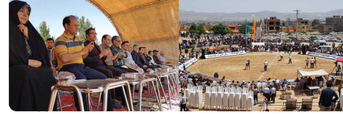
حضور ریاست و اعضای شورای اسلامی شهر بجنورد در مراسم تکریم و معارفه هیئت مدیره و معارفه هیئت مدیره فرماندار جدید بجنورد