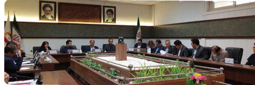
حضور معاونین و مدیران شهرداری بجنورد در جلسه رسمی شورا