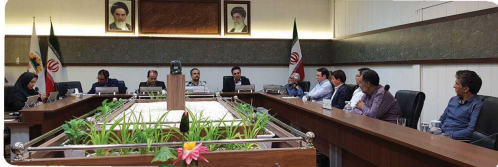
کمیسیون عمران معماری و شهرسازی با حضور اعضا و میهمانان