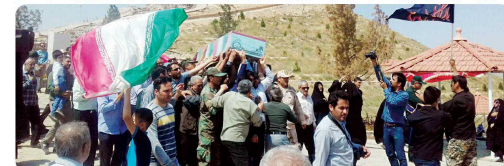
حضور اعضای شورای اسلامی شهر بجنورد در مراسم تشیع پیکر شهید گمنام در پارک دوار