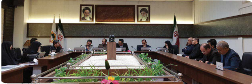
کمیسیون فرهنگی اجتماعی با حضور اعضا و میهمانان