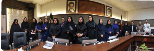
حضور اعضای بانوان در جلسه کمیته بانوان کمیسیون فرهنگی اجتماعی در محل ساکن جلسات