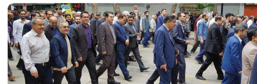
حضور ریاست و اعضای شورای اسلامی شهر بجنورد در مراسم روز جهانی قدس