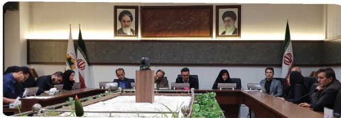
برگزاری جلسه کمیسیون ورزش و جوانان با حضور اعضا و مربیان برتر ورزشی استان خراسان شمالی