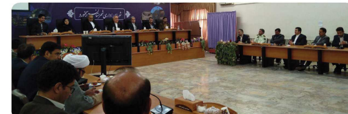
حضور ریاست و اعضای شورای اسلامی شهر بجنورد در مراسم تکریم و معارفه هیئت مدیره فرماندار جدید بجنورد