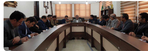
برگزاری جلسه هم اندیشی با هیئت علمی دانشگاه کوثر بجنورد با حضور ریاست و اعضای شورای اسلامی شهر بجنورد