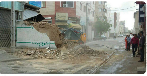
شهرداری بجنورد رتبه برتر فعالیت در حوزه مبارزه با مواد مخدر را بین دستگاہ های اجرایی استان کسب کرد

بازگشایی و تعریض کوچه عزیز مصر پس از توافق با مالکین و تملک ملکی واقع کوچه عزیز مصر این کوچه تعریض و بازگشایی شد تا ترافیک آن تسهیل و روان شود. کوچه عزیز مصر در بجنورد که یکی از مسیرهای پر تردد هسته مرکزی شهر محسوب می شود با تخریب یک ملک در مسیر بازگشایی شد تا شهروندان خوبان از این پس با ایمنی بیشتری بتوانند از این مسیر تردد کنند. این اقدام توسط مأمورین آلات شهرداری و پس از توافق با مالک در هفتم تیرماه به انجام رسید. به گزارش واحد ارتباطات کار عملیات تخریب و نخاله برداری این ملک ، در روز جمعه انجام گرفت تا برای ساکنین محل و شهروندان کمترین مزاحمت ایجاد شده باشد.