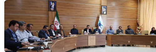
برگزاری جلسه هم اندیشی با هیئت علمی دانشگاه آزاد اسلامی واحد بجنورد با حضور ریاست و اعضای شورای اسلامی شهر بجنورد