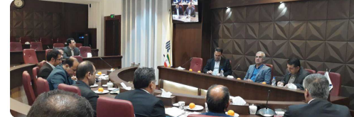
برگزاری جلسه هم اندیشی با هیئت علمی دانشگاه دولتی بجنورد با حضور ریاست و اعضای شورای اسلامی شهر بجنورد