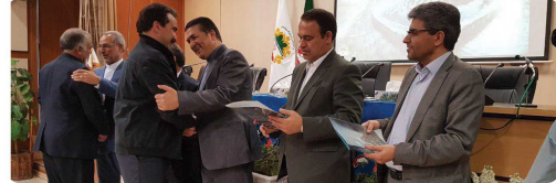
بررسی تقدیر و شکر از تلاش های یکساله کارکنان شهرداری با حضور ریاست و اعضای شورای اسلامی شهر، فرماندار خراسان، مدیر کل امور شهری و شوراها و شهردار بجنورد