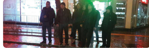
حضور ریاست و اعضاء شورای اسلامی شهر بهمراه شهردار، مدیران شهرداری در جلسه و بازدید مدیریت بحران شهر بجنورد و رفع و مدیریت آب های سطحی