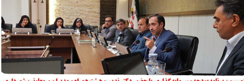
کمیسیون برنامه بودجه و سرمایه گذاری با حضور دکتر ندیم و هیئت همراه و مدیران و معاونین شهرداری