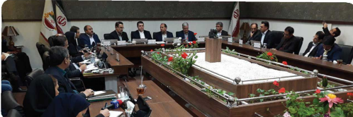
حضور دکتر شعبانی استاندار خراسان شمالی و هیئت همراه بمناسبت هفته شوراها در جلسه رسمی شورای اسلامی شهر