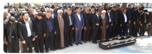
حضور ریاست و اعضای شورای اسلامی شهر بهمراه شهردار و مدیران و مسئولین استانی در مراسم تبریک پیگر بنید و شاهر در هیئت حاج داراب بدشجان