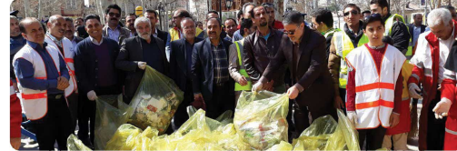
حضور شورای اسلامی شهر بجنورد بهمراه مدیران و مسئولین و شهروندان بجنوردی در مراسم شکرگزار جمع آوری زباله ها از معابر شهر