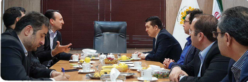
جلسه ریاست شورای اسلامی شهر با مدیر کل آبنای خراسان شمالی به همراه مدیران و معاونین در محل دفتر ریاست شورای اسلامی شهر