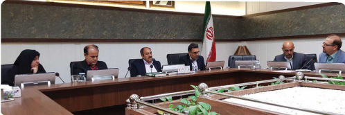
کمیسیون خدمات و زیست شهری با حضور اعضا و مدیران و معاونین شهرداری