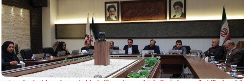
برگزاری جلسه تلفیقی کمیسیون های فرهنگی اجتماعی و ورزش و جوانان شورا با حضور مدیران و معاونین شهرداری بخنورد