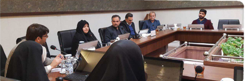
کمیسیون عمران معماری و شهرسازی با حضور اعضا و میهمانان