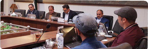
کمیسیون فرهنگی اجتماعی با حضور اعضا و میهمانان