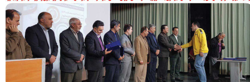
برگزاری مراسم تجلیل از مقام آوران بجنوردی در حرم های جهانی با حضور ریاست و اعضای شورای اسلامی شهر بهمراه شهردار و مدیران استانی