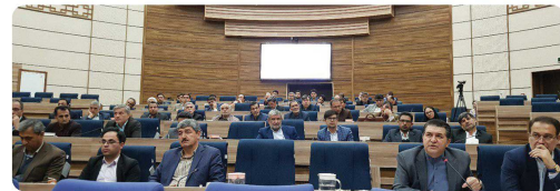
گردهمایی شهرداران و نمایان شورای استان خراسان شمالی با حضور دکتر شجاعی استاندار خراسان شمالی

دیدار با خانواده شهید والامقام حاج محمدکلاکته نماینده مردم بجنورد در مجلس شورای اسلامی با حضور ریاست و اعضای شورای اسلامی شهر و مدیران شهرداری بجنورد