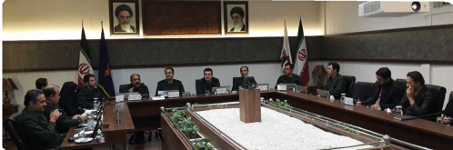
ملیس شدن به لباس سپاه پاسداران در محکومیت اقدام غیر قانونی دولت آمریکا با حضور شهردار بخنورد در جلسه رسمی شورا