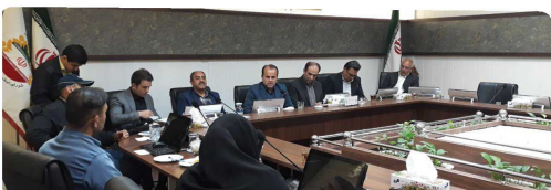
برگزاری جلسه کمیسیون ورزش و جوانان با حضور اعضا و مربیان برتر ورزشی استان خراسان شمالی