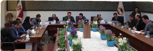
حضور روح آ... برائیان شهردار بخنورد در آخرین جلسه رسمی شورا در سال ۹۷ و ارائه گزارش و اقدامات ساد استقبال از بهار