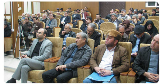
اولین همایش معتمدین محلات شهر بجنورد با حضور اعضای شورای اسلامی شهر بجنورد ، شهردار بجنورد و معتمدین محلات در محل سالن همایش شورای اسلامی شهر بجنورد برگزار گردید