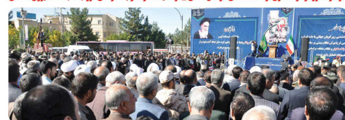
حضور اعضای شورای اسلامی در مراسم یوم ۱۳۰۰ آبان همراه با مردم همیشه در صحنه بخورد