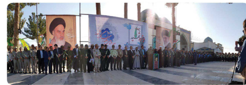
مراسم عطوفت‌افشایی و غبارروبی مزار شهدا با حضور اعضای شورای اسلامی شهر بخورد در هفته دفاع مقدس