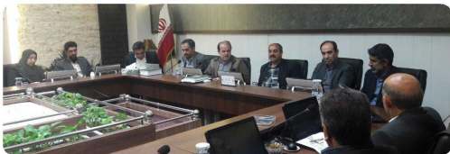
کمیسیون خدمات و زیست شهری با حضور اعضاء