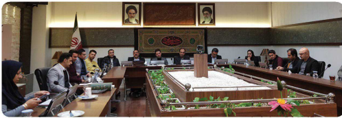
کمیسیون ورزش و جوانان با حضور اعضاء و میهمانان