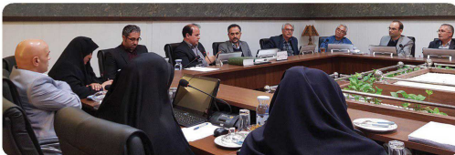
کمیسیون عمران معماری و شهرسازی با حضور اعضاء