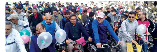
حضور اعضای شورای اسلامی شهر، شهردار و مدیران شهرداری در همایش دوچرخه سواری پدران و پسران