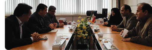
دیدار ریاست و اعضای شورای اسلامی شهر بخورد با مهندس عرب مدیر کل دفتر امور شهری شوراها استان خراسان شمالی