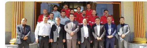
بازدید اعضای شورای اسلامی شهر به مناسبت ۷ روز آتش نشان از سازمان آتش نشانی و خدمات ایمنی