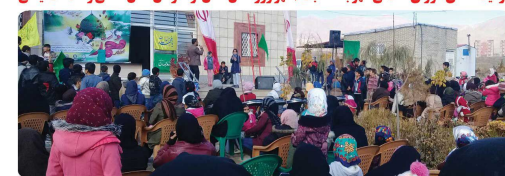
حضور اعضای شورای اسلامی شهر در مراسم جشن شهروند در گلستان شهر به مناسبت میلاد پیامبر اکرم (ص)