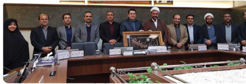
حضور مدیر کل اولفاد و امور خیریه استان خراسان شمالی و هیئت همراه در جلسه رسمی