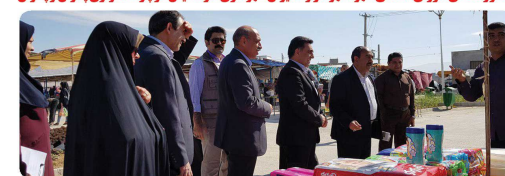
بازدید اعضای شورای اسلامی شهر از دوشنبه بازار