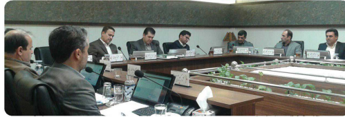
حضور مدیران کل فرهنگ و ارشاد اسلامی و نهاد کتابخانه های استان خراسان شمالی بپراه شهردار بجنورد در جلسه رسمی