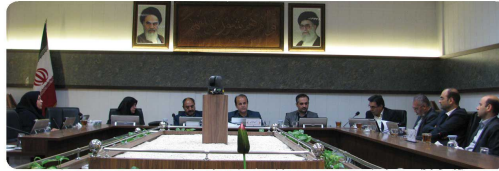
کمیسیون برنامه بودجه و سرمایه گذاری با حضور اعضاء و مدیران و معاونین شهرداری