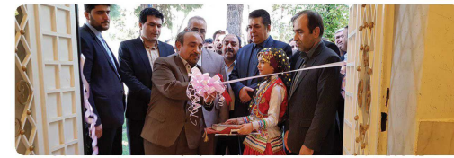
حضور ریاست و اعضای شورای اسلامی در افتتاحیه مجمع خیرین استان با حضور دکتر خیابان استاندار خراسان شمالی