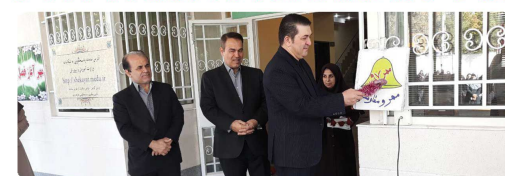
نواختن رنگ میر و مقاومت توسط ریاست شورای اسلامی بهره‌آفرین اعضای شورا و شهردار بخورد در دبیرستان دخترانه عملی نژاد