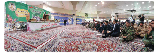
حضور اعضای شورای اسلامی شهر و شهردار بخورد در اجتماع ۵۰۰ نفری بسیجیان پیمانست هفته بسیج