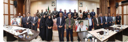
اولین همایش ادوار شورای اسلامی شهر بخورد با حضور اعضای شورای اسلامی شهر بخورد و ادوار گذشته