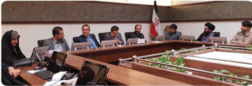
کمیسیون فرهنگی اجتماعی با حضور اعضاء و میهمانان