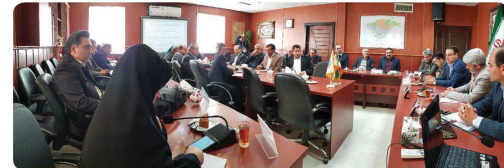
حضور اعضای شورای اسلامی شهر بخورد در جلسه بداندن غیر عامل کارکنان