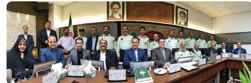
حضور و حضور سردار مظفری فرمانده انتظامی خراسان شمالی بهره‌آفرین هیئت همراه در جلسه رسمی شورا پیمانست هفته نیروی انتظامی