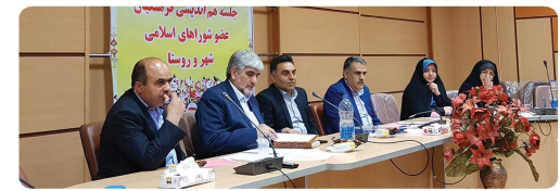
جلسه هم اندیشی فرهنگیان عضو در شوراهاى اسلامی شهر و روسا با حضور مدیر کل آموزش و پرورش استان خراسان شمالی