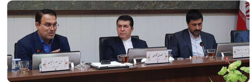
حضور سرپرست سازمان میراث فرهنگی و گردشگری و صنایع دستی استان خراسان شمالی و شهردار در جلسه رسمی شورا