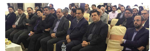
حضور اعضای شورای اسلامی و شهردار بجنورد در چهاردهمین سالگرد تأسیس روزنامه خراسان شمالی