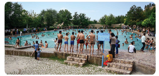
اقبال عمومی شهروندان بجنوردی از استخر عمومی پارک بش قارداش در روزهای داغ تابستان

پارک ملی گردشگری بش قارداش در روزهای داغ تابستانی حتی بیش از ظرفیت شاهد حضور مسافران و شهروندانی است که از گرمای تابستانی و دماهای هوای شهر به هوای مطبوع، خنک و ملایم این پارک پناه آورده اند تا ساعات خوشی را در کنار خانواده رقم بزنند. استخر عمومی این پارک البته نقش مهمی در جذب شهروندان گرما زده دارد. شهردار بجنورد با ابراز خرسندی از وجود اماکنی که برای شهروندان جذاب و مورد استقبال است گفت: در این ایام با توجه به افزایش حضور شهروندان تمهیدات ویژه ای برای حفظ بهداشت عمومی و نظافت اماکن پارکی اعمال می کنیم.