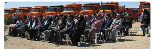
حضور اعضای شورای اسلامی شهر به همراه شهردار و مدیران شهرداری در مراسم کلنگ زنی طرح بهسازی پارک دوپزار