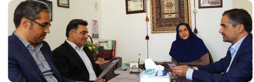
بازدید اعضای شورای اسلامی شهر از کارگاه گلیم بافی و قالی روزین بجنورد