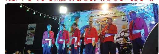
حضور اعضای شورای اسلامی شهر، استاندار و معاین، شهردار و مدیران شهرداری در مراسم جشن شهروند در پایا امان