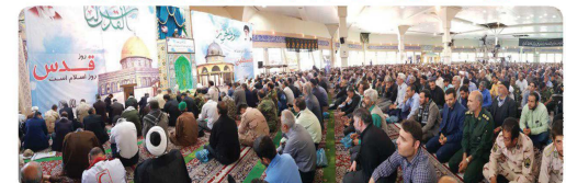
حضور اعضای شورای اسلامی شهر، شهردار و مدیران شهرداری در مراسم روز جهانی قدس در مصلى امام خمینی (ره)