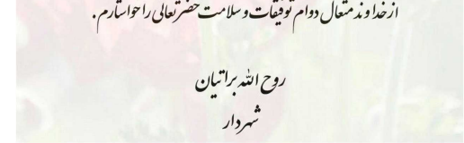
روح الله براتیان شهردار

ارضا و ذمتمعال دوام توفیقات و سلامت حضرتعالی را خواستارم.