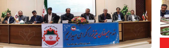
جلسه هم اندیشی مدیران باشگاه های ورزشی با حضور دادستان بجنورد و اعضاء شورای اسلامی شهر و مدیر کل ورزش و جوانان

تصویب نام گذاری کتابخانه عمومی بجنورد واقع در تقاطع شهید صیاد شیرازی و سید جمال الدین اسد آبادی به نام آیت... همچنان نواز