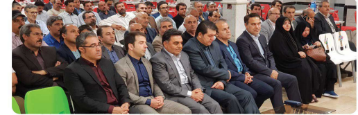
نشست هم اندیشی ریاست و اعضای شورای اسلامی و شهردار بجنورد با شورایاران محلات شهر بجنورد