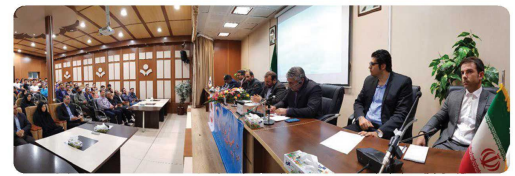
نشست اعضای شورای اسلامی شهر بجنورد با مدیران کل ورزش و جوانان و مدیران باشگاه ها