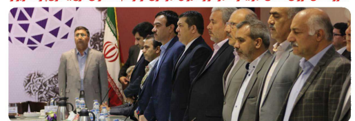
حضور ریاست شورای اسلامی شهر بجنورد در نشست و یکمین اجلاس مجمع شورایی روسای شوراهاى کلان شهرها و مراکز استان