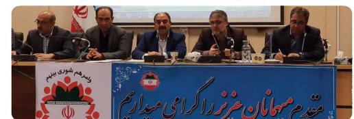
نشست هم اندیشی اعضای شورای اسلامی شهر با مدیر کل محیط زیست استان خراسان شمالی