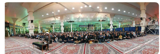
حضور اعضای شورای اسلامی شهر، شهردار و مدیران شهرداری در مراسم پریش شیب های قدر در مصلى امام خمینی (ره)