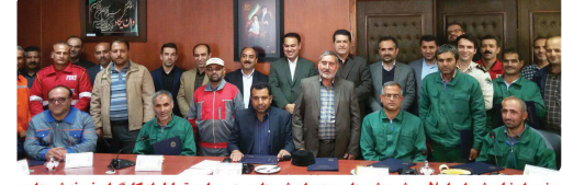
حضور اعضای شورای اسلامی شهر، شهردار و مدیران شهرداری در مراسم تجلیل از کارگران نمونه شهرداری