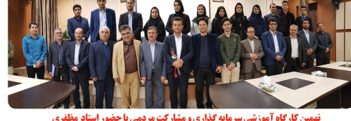
نهمین کارگاه آموزشی سرمایه گذاری و مشارکت مردمی با حضور استاد مظفری