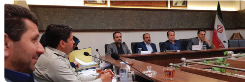
کمیسیون برنامه بودجه و سرمایه گذاری با حضور اعضا و مدیران و معاونین شهرداری

تهدیدهای متعدد زیست محیطی چالش پیش روی مدیریت شهری است که باید با تغییر نگرش در مدیریت برای تحول اقتصادی آینده خود را بروز و آماده نگاه داریم.