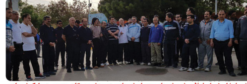
حضور اعضای شورای اسلامی شهر، شهردار و مدیران شهرداری در ورزش سبکگاهی عمومی در پارک شهر بازی