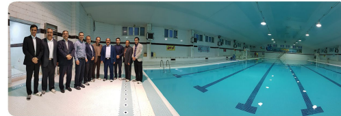
حضور اعضاء شورای اسلامی و شهردار و مدیران شهرداری در مراسم بازپیرایی و افتتاح استخر شهروند