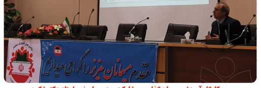
سومین کارگاه آموزشی سرمایه گذاری و مشارکت مردمی با حضور استاد دکتر شکوهی