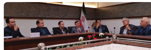
حضور دکتر ندیم پدر علم سرمایه گذاری شهری ها با فعالان حوزه اقتصادی و سرمایه گذاری بجنورد