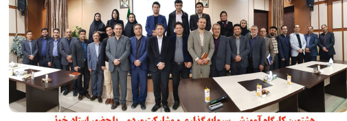
هشتمین کارگاه آموزشی سرمایه گذاری و مشارکت مردمی با حضور استاد خونی