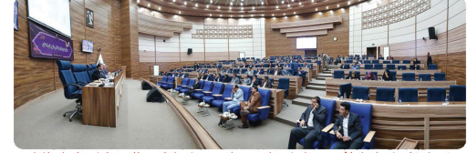
حضور اعضای شورای اسلامی به همراه شهردار در مراسم روز شوراها در سالن همایش های استانداری