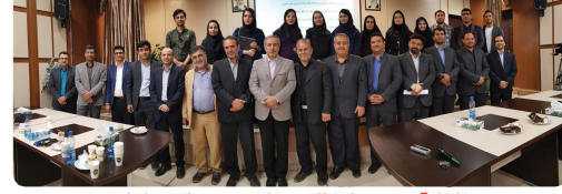
هفتمین کارگاه آموزشی سرمایه گذاری و مشارکت مردمی با حضور استاد یوسنی