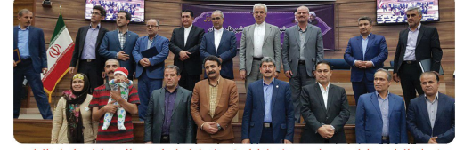
حضور استاندار و معاونین در مراسم روز شوراها با حضور شوراها استان در سالن همایش های استانداری