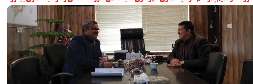
جلسه مشترک مدیر کل صنعت و معدن استان با ریاست شورا و شهردار بجنورد