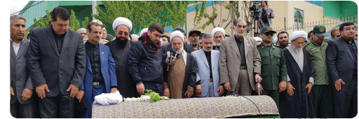
حضور اعضای شورای اسلامی به همراه شهردار در مراسم تشییع پیکر حضرت آیت ا... مهمان نواز