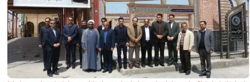
حضور اعضای شورای اسلامی شهر به همراه شهردار و مدیران شهرداری در مراسم خیراتوی عزرا شهید به مناسبت روز شوراها