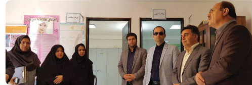
بازدید اعضاء شورای اسلامی به همراه معاون فنی و عمران شهرداری از پروژه های خیرین سلامت شهرستان بجنورد