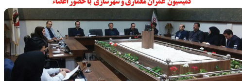
جلسه ریاست کمیسیون برنامه و بودجه و سرمایه گذاری با کار گروه اجرایی میز اقتصادی با حضور دکتر ندیم