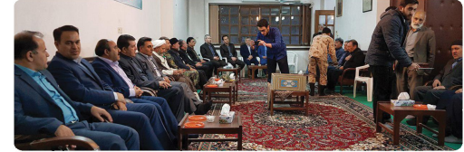
حضور اعضای شورای اسلامی شهر و شهردار و بنیابست رحلت آیت ا... مهمان نواز در بیت ایشان