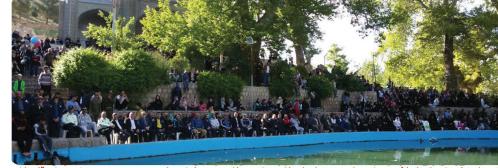
حضور اعضای شورای اسلامی و شهردار و مدیران استانی و شهرستانی در همایش یاده روی عمومی به مقصد بن کار دان