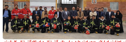
حضور اعضاء شورای اسلامی به همراه شهردار در مراسم مانور آتش نشانی در ایستگاه آتش نشانی گلستان شهر