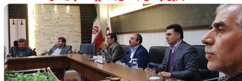
کمیسیون خدمات و زیست شهری با حضور اعضا