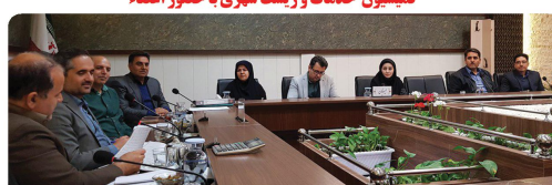
کمیسیون عمران معماری و شهرسازی با حضور اعضا