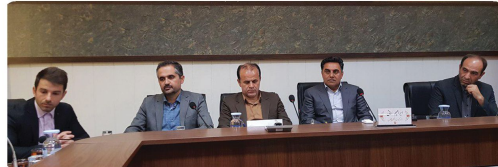
کمیسیون فرهنگی اجتماعی با حضور اعضا و میهمانان