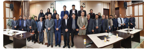
حضور اعضاء شورای اسلامی و مدیران شهرداری در نهمین کارگاه تخصصی سرمایه گذاری