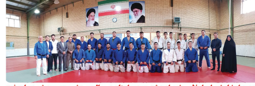
بازدید اعضاء شورای اسلامی شهر از هیئت جودوی استان در سالن ورزشی مجموعه شهید علیدخت