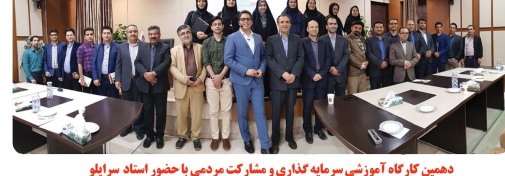
دهمین کارگاه آموزشی سرمایه گذاری و مشارکت مردمی با حضور استاد اسراوی