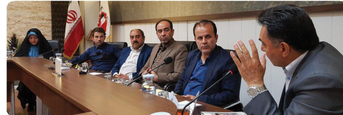
کمیسیون ورزش و جوانان با حضور اعضا و میهمانان