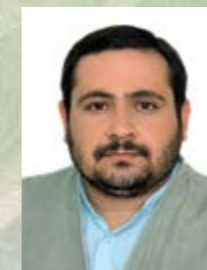
حجت الاسلام یحیی علوی فرد