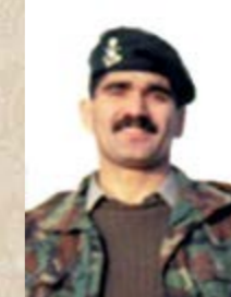
شهید محمد علی صفا