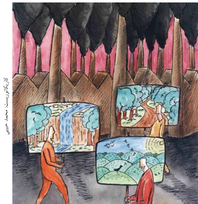
کارکاتوریستا: محمد حسینی

نویسنده: غلامرضا فستقزی سال انتشار: ۱۳۹۲