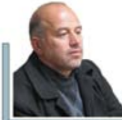
سید محمد لنگری رئیس شورای اسلامی شهر بجنورد

رئیس شورای اسلامی شهر با اعلام این که کل اعتبارات اختصاص یافته به شهرداری بجنورد، در سال جاری تا کنون ۷۲۰ میلیون تومان است، گفت: بخشی از این اعتبارات شامل ۴۰۰ میلیون تومان برای جمع آوری آب های سطحی شهر بجنورد و اصلاح شبکه معابر درون شهری اختصاص داده شد که از محل جذب اعتبارات دارایی های سرمایه ای بوده و مبلغ ۳۰۰ میلیون تومان آن از محل اعتبارات مدیریت بحران تأمین شده و مبلغ ۳۴ میلیون تومان نیز به سازمان اتوبوسرانی اختصاص یافته است. سید محمد لنگری افزود: این مبالغ حتی برای زیرسازی و آسفالت یک محله هم کافی نیست تا چه رسد به شهر؛ حال قضاوت کنید با این مبالغ چه اقدام عمرانی در این شهر می توان انجام داد؟ وی گفت: هزینه زیاده برداری در شهر بجنورد، سالانه بیش از ۱۵ میلیارد ریال است.