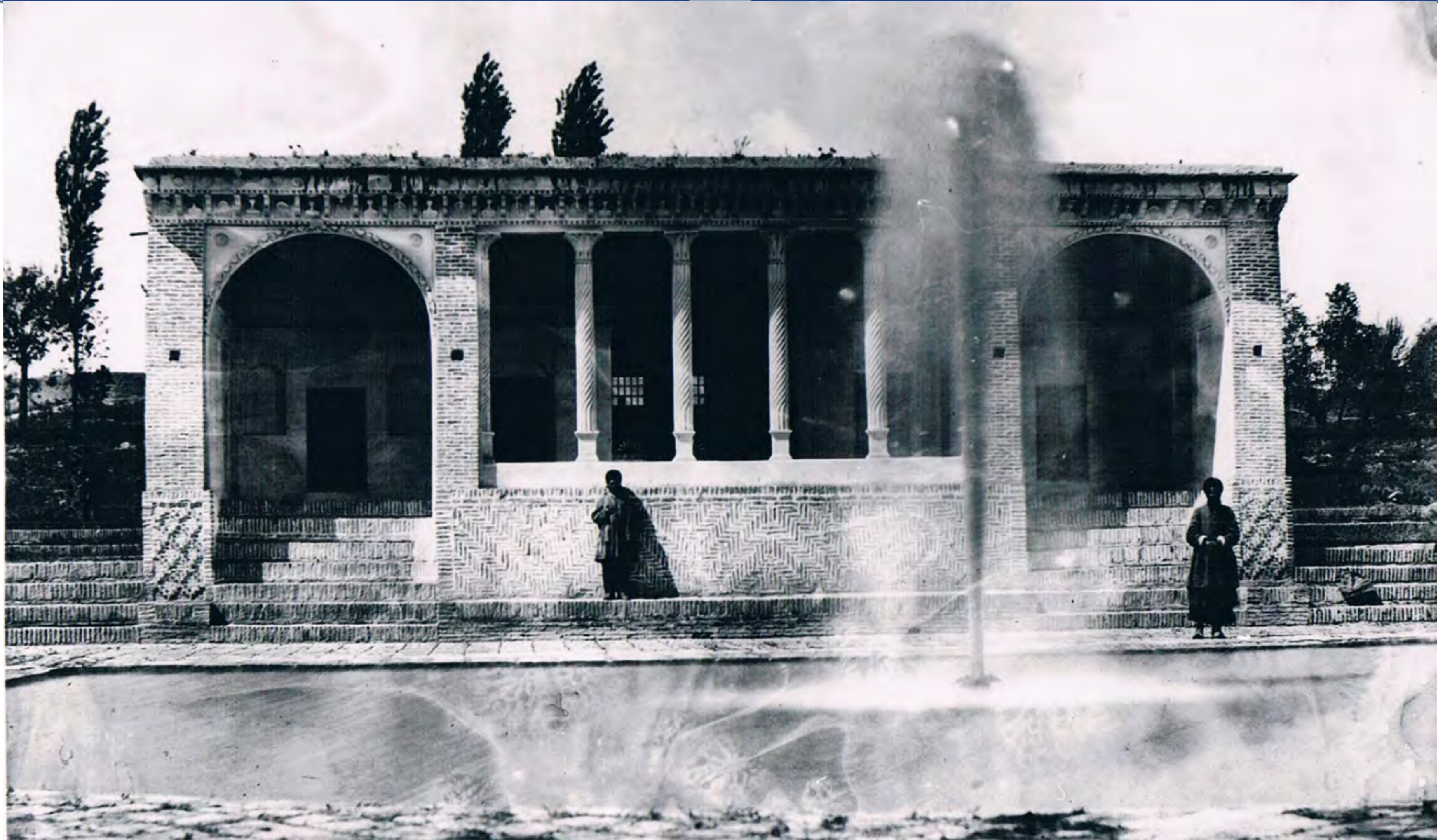
عکس از دورنمای عمارت باغ فواره سهام الدوله مربوط به بیش از صد سال گذشته (واقع شده بود در انتهای خیابان فردوسی کنونی، (پادگان ارتش))