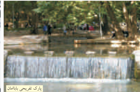
پارک تفریحی بابامان