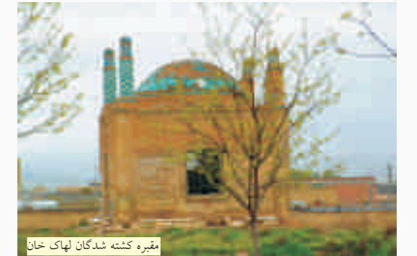
مقبره کشته شدگان لهاک خان