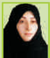
اعظم السادات افشین فر

روزهایی زیبا، پربرکت و پر طراوت برای هموطنان عزیز آرزو مندیم.