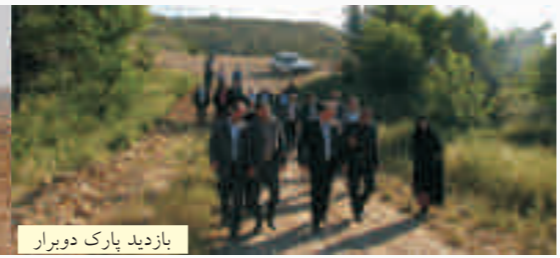
افتتاح پارک بانوان