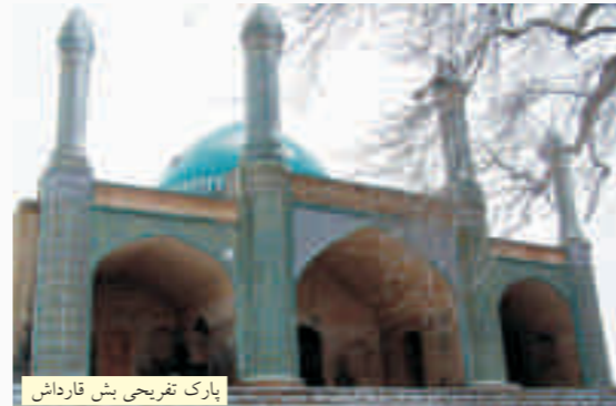
پارک تفریحی بش قارداش

مجموعه تفریحی بابامان در منطقه جنگلی حاشیه جاده ارتباطی بجنورد به مشهد با هشت استخر و